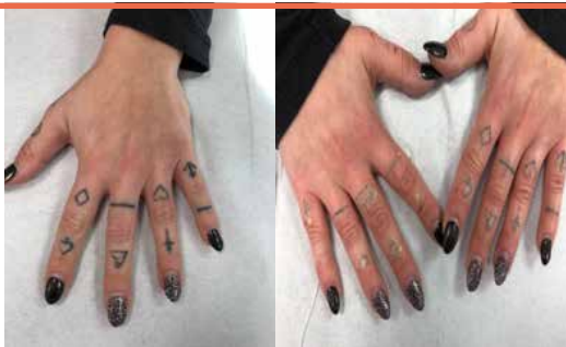
Aspetto successivo alla 1ª applicazione

La combinazione di frequenza 1064/532nm consente di effettuare il trattamento di tatuaggi, delle lesioni pigmentate benigne sia epidermiche e che dermiche.